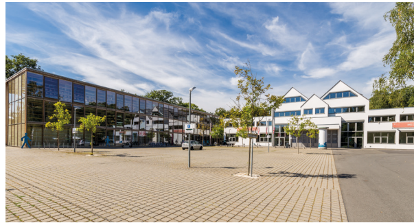
Willkommen auf unserem Campus im Grünen...