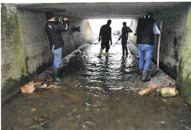
Bild 1: Nach der Installation der Metallgitter im November 2017 unter dem Brückenbauwerk wurden im Rahmen eines Projekttag der HS RheinMain aus Wiesbaden die Zwischenräume mit ortstypischen Sedimenten befüllt.

Neben dem Benthos-Pass wurde am GN-Tag am 23. Mai 2018 auch die Umgestaltung des Rheinufer im Bereich der Walluf-Mündung vorgestellt. Hierbei stand die Renaturierung des Mündungsbereiches im Vordergrund. Dabei sollten naturnahe Strukturen im Mündungsbereich realisiert werden als auch die Bedeutung des Gewässers für die Naherholung und damit die mögliche Freizeitnutzung durch die Anwohner aufgezeigt werden.