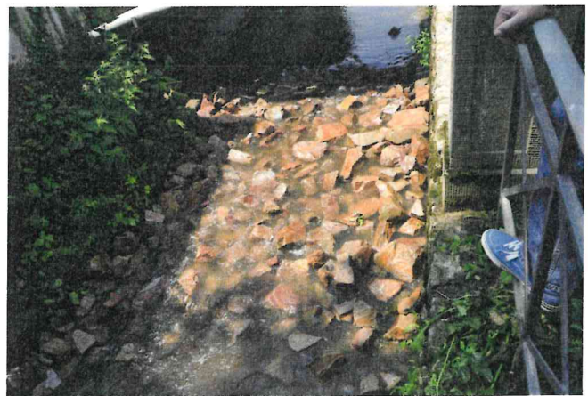
Bild 5: Die Walluf ist nunmehr durch die Installation des Benthos-Passes und der Anschüttung der Sohlenschwellen zu einer rauen Rampe ab dem Mündungsbereich die ersten Kilometer durchgängig.