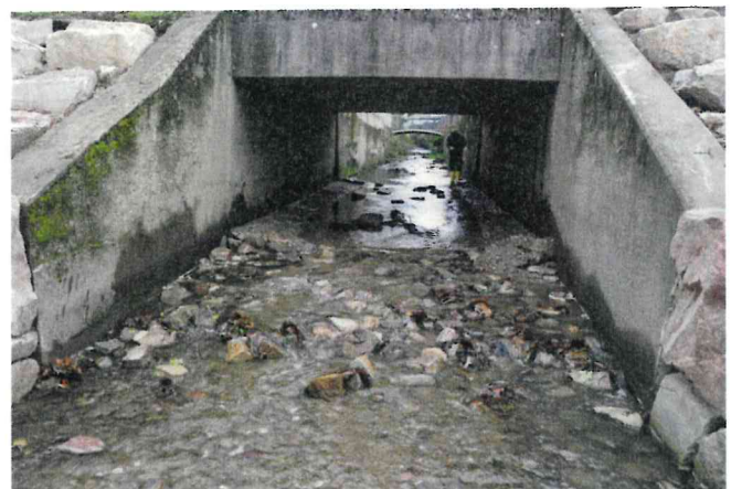
Bild 2: Die sohlgleiche Anbindung des „Benthos-Passes“ im Brückenbauwerk wurde durch die Anschüttung einer rauen Gleite im Unterwasser erreicht.