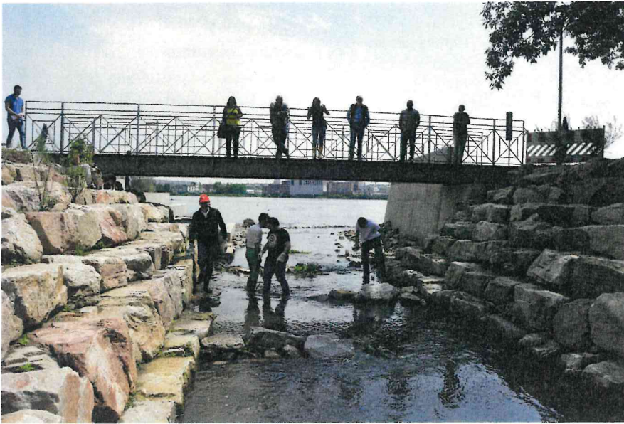
Bild 3: Der Mündungsbereich der Walluf in den Rhein wurde im Frühjahr 2018 linear mit einer durchgängig rauen Sohle angebunden. Gleichzeitig dient der Bereich der Naherholung und Freizeitnutzung.

benötigte Steinmaterial wurden von der Gemeinde Walluf übernommen.