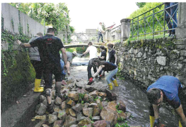
Bild 4: Oberhalb des neuen Benthos-Passes verhindert ein Sohlenabsturz die freie Wanderung der aquatischen Lebewesen. Das angelieferte Steinmaterial wurde per Hand im Rahmen des GNTages eingebaut.

Lebewesen sowie Geschiebe wieder passierbar. Alle Teilnehmer/innen der Gewässer-Nachbarschaften packten mit an, um die zuvor angelieferten Steine im Bachbett in Form einer rauen, flach geneigten Rampe zu setzen. Tatkraftige Unterstützung kam dabei auch von den verschiedenen Fachbehörden, den Vertretern des HNLUG, der HS RheinMain sowie des RP Darmstadt. Die Kosten für das